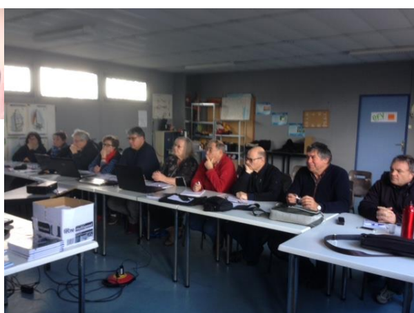
En Occitanie le 3 février à Narbonne