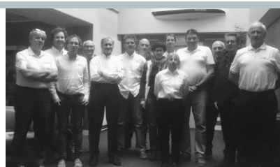
Umpires 3 et 4 février

Les week-ends des 16 et 17 décembre et 3 et 4 février, ont eu lieu les formations nationales continues des arbitres nationaux, organisées par la Commission Centrale d'Arbitrage. 33 juges, 11 umpires, 53 comités de courses et 16 comités techniques étaient présents. Merci aux 8 formateurs qui ont encadré ces formations.