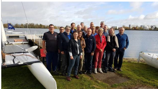
En Nouvelle-Aquitaine les 11 et 12 novembre au Centre de Voile de Bordeaux Lac