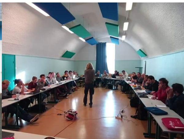
En Provence Alpes Côte d'Azur les 27 et 28 janvier (entraîneurs) à La Londe