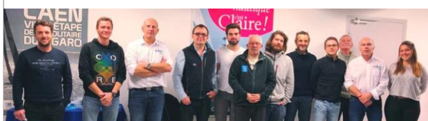
En Normandie les 13 et 27 janvier à Caen