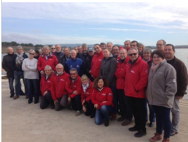
La Commission Régionale d'Arbitrage Occitanie le samedi 13 janvier