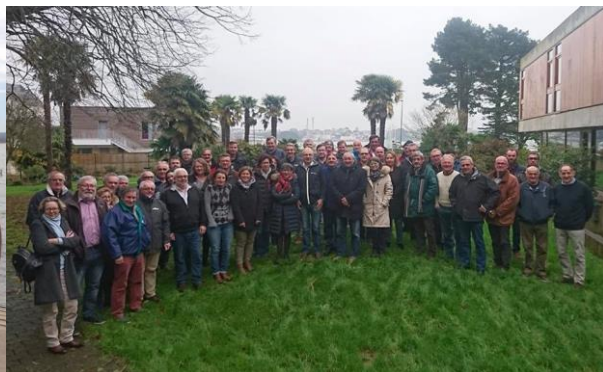
La Commission Régionale d'Arbitrage Bretagne (CDA Finistère) le samedi 13 janvier