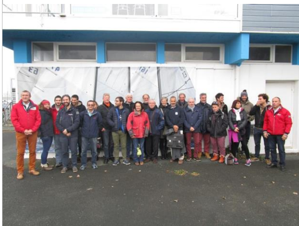
En Nouvelle-Aquitaine les 9 et 10 décembre à La Rochelle