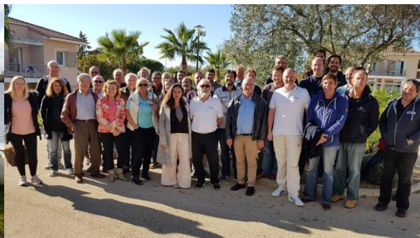
En Provence Alpes Côte d'Azur les 18 et 19 novembre à La Londe