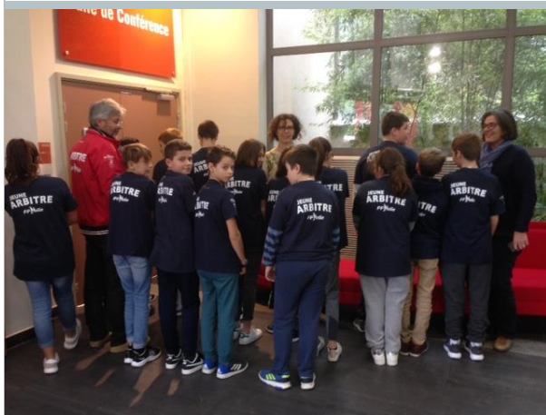
Comités de course et techniques, juges 16 et 17 décembre